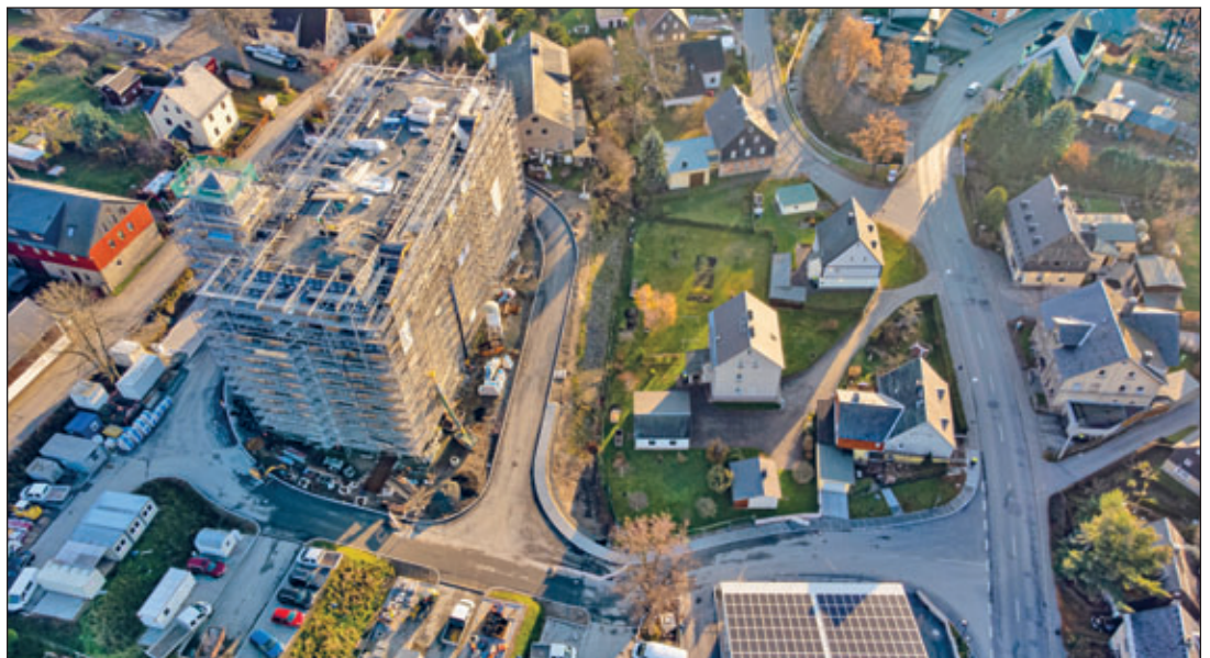
Das Außenareal des buntSPEICHERs wird Veranstaltungsort für das Makerfestival. Ein Großteil der Arbeiten im Außenbereich soll bis dahin abgeschlossen sein.

Die Bandbreite an handwerklichen Tätigkeiten und Projekten, die dort realisiert werden können, ist dabei breit und auch von den Nutzerinnen und Nutzern vor Ort abhängig. Um Ihnen einen Einblick zu geben, was zukünftig im Makerspace in Zwönitz möglich sein könnte, wird das Areal des Zwönitzer buntSPEICHERs am 17.06.2023 zum Austragungsort des diesjährigen Makerfestivals Erzgebirge. Der eine oder andere kennt ähnliche Veranstaltungen vielleicht bereits, z. B. aus Chemnitz. In Zwönitz sollen dann Mitte Juni vor allem lokale Akteure zum Mitmachen anregen. Ein spannender Tag für Groß und Klein ist dabei sicher. In den kommenden Monaten werden wir auch im Anzeiger immer wieder Akteure und Aus-