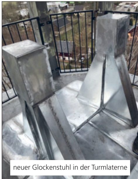
neuer Glockenstuhl in der Turmlaterne

In herzlicher Verbundenheit und im Namen des Ortsausschusses/der Glockengruppe, Friedemann Müller