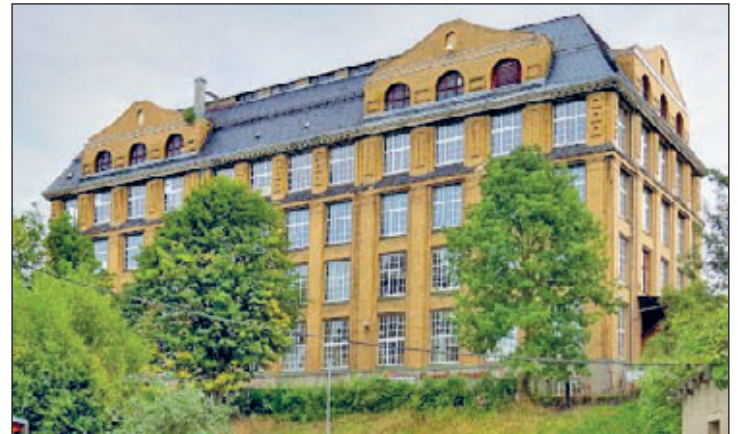
Friedemann Bähr, Stollberg

meinschaft gründete sich 1990 der Modelleisenbahnclub Grünhain. Auf der Suche nach geeigneten Räumlichkeiten für eine Schau führte der Weg 1992 in den Speicher nach Zwönitz. (Foto) Zweimal im Jahr führten die Modellbahner ihr Wirken der Öffentlichkeit vor. 12 Anlagen in verschiedenen Spurrößen wurden auf ca. 300 m 2 den Besuchern vorgeführt. Eine Modellbahnanlage mit ihren detailgenauen Miniaturen blieb prinzipiell immer eine kleine Baustelle und so wurden auch Anlagen bei der Neu- und Umgestaltung präsentiert. Durch bauliche Maßnahmen im Gebäude des Speichers musste der Modellbahnclub etwas enger zusammenrücken.