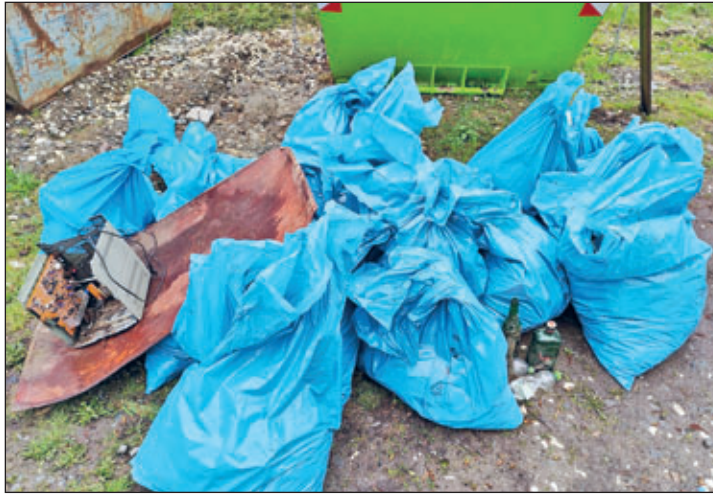
Zwönitz Miteinander e. V.

Zwönitzer Bürgerinnen und Bürger und ukrainische Familien, die hier in Zwönitz eine Bleibe gefunden haben, packten gemeinsam an – als ganz praktische Form der Begegnung und Integration. Alle rückten dem achtlos weggeworfenen Abfall im Neubau, in der Innenstadt und im Austelpark zu Leibe. Die Plogger am Richterbüschel verfi-