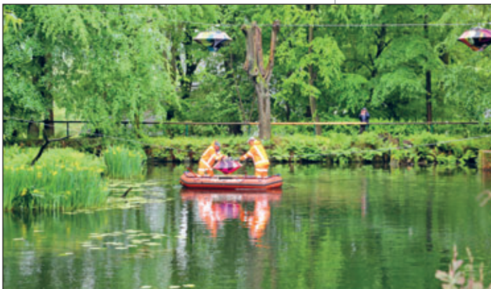
Bei der Installation des Kunstwerkes „Color Floating“ über dem Austelteich waren die Mitarbeiter des Bauhofes ganz besonders gefordert.

Wir freuen uns auf viele Besucherinnen und Besucher, die sich neben den Klängen der Fête de la Musique für ein weiteres künstlerisches Highlight begeistern und die Eröffnung der tollen Lichtinstallation an diesem Abend live miterleben wollen.