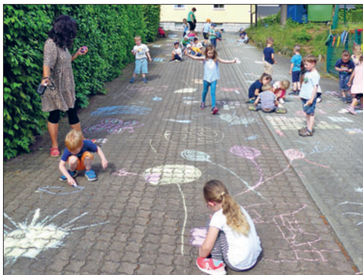
Bei den Vorbereitungen der Festwoche halfen die Kinder fleißig mit und bemalten die Fußwege rund um die Kita.

15.30 Uhr stand unmittelbar bevor – und überall Deko aus großen, gelben Sonnenblumen, die Namens-Paten der Kita.