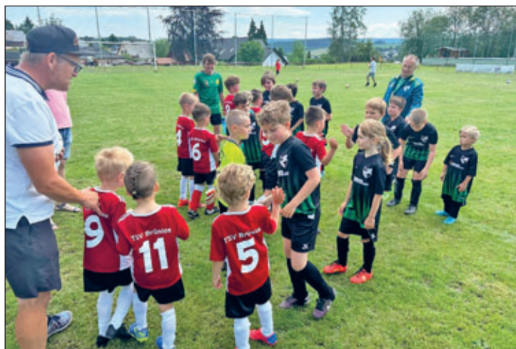
Aufregung pur: die neugegründete „Bambini-Mannschaft“ vor ihrem ersten Spiel

Am Samstag, 10.06. veranstaltete der TSV Brünlos einen Sporttag, der auf die Gründung der BSG Fortschritt Brünlos im Jahr 1953 zurückführt. Bei bestem Wetter bot der Tag einige Aktionen, nicht nur zum Zuschauen, sondern auch zum selbst Aktivwerden. So hatte Jung und Alt am Vormittag die Möglichkeit, ihr Sportabzeichen am Waldsportplatz Brünlos abzulegen.