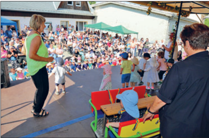
Jede Gruppe der Kita – hier die Gruppen der Eichhörnchen, Schmetterlinge (oben) und die Krippenkinder der Käfergruppe (unten) – wirkte an dem bunten Programm des großen Familienfestes am Waldsportplatz am 9. Juni mit.