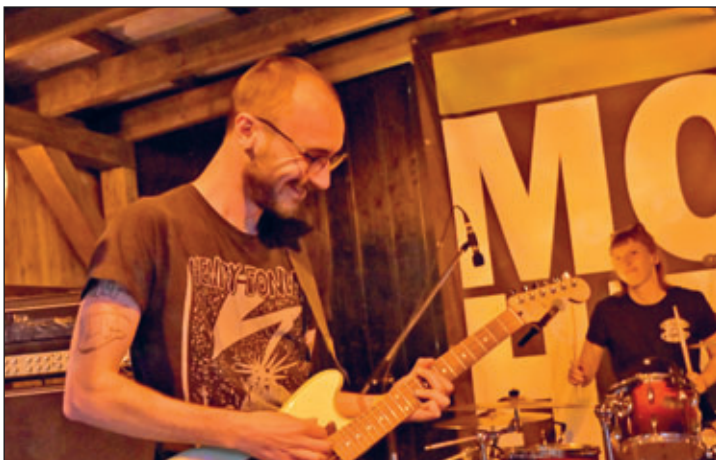
Am Abend spielte unter anderem die Band „Magdebored“.