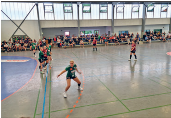
Zahlreiche Interessierte waren an beiden Tagen zu den Turnieren am Start

Geschuldet der Tatsache, dass die Zwönitzer Rocknacht - welche vor Corona stets mit dem Vereinsfest gemeinsam veranstaltet wurde - nach der Pandemie leider noch nicht wiederbelebt werden konnte, wurde nun ein anderes Event gesucht und mit dem Männerturnier am Samstag und tags darauf das der Frauen auch gefunden.