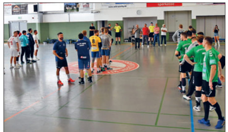
Eröffnung des Männerturniers u. a. mit Bürgermeister Wolfgang Triebert

Und wie es sich für einen guten Gastgeber gehört, haben auch 2023 sowohl die Männer als auch die Frauen den Pott jeweils einer ihrer Gastmannschaften überlassen ... ;o)