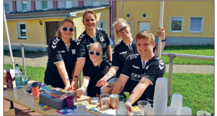
Reges Treiben auch am Tattoo- und Bastelstand

Die Hüpfburg war dabei natürlich die beste Gelegenheit für die Kids, sich dort mal wieder nach Herzen auszutoben.