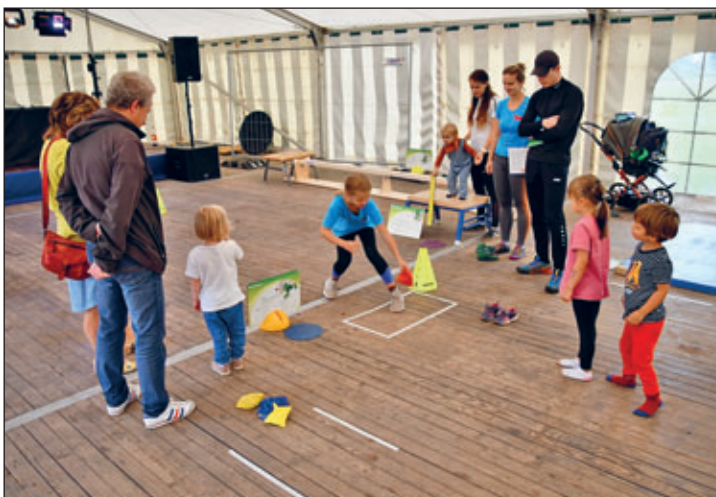
Kinderparcours der Leichtathletikabteilung

Die große Zahl der Interessierten, die sich am Samstag und Sonntag zu den Turnieren und an den Stationen des Familienfests einfanden sollte den 28-ern durchaus Recht geben, dass man auch künftig über eine solche Kombination des Fests nachdenken kann.