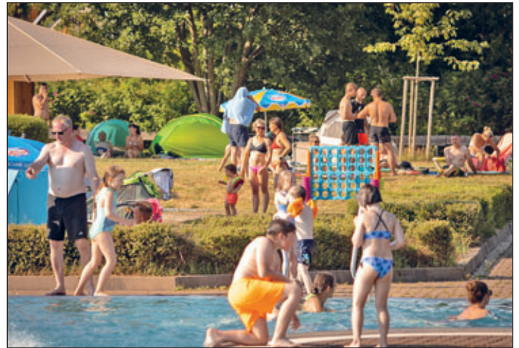
Ob in Zwönitz (links) oder in Brünlos (rechts): in beiden Bädern war in diesem Jahr deutlich mehr los an noch im vergangenen.

Aktuell legt der Sommer noch einmal eine Extraschicht ein. Hohe Temperaturen und Sonnenschein sorgten Anfang September für bestes Urlaubsfeeling. Die Freibadsaison im Zwönitzer Erlebnisbad und im Freibad in Brünlos war da allerdings bereits vorbei. Gründe hierfür gab es einige. Zum einen nehmen die Außentemperaturen nachts mittlerweile deutlich ab. Das hat zur Folge, dass die Wassertemperatur nur durch aufwendiges Heizen gehalten werden kann. Zum anderen sind viele der Mitarbeiter der Freibäder mittlerweile wieder in den Erlebnisbädern in der Halle im Einsatz und fehlen entsprechend für den „Außeneinsatz“.