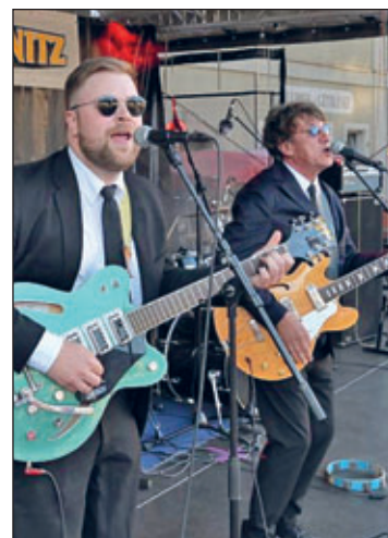
Auch einige Zwönitzer werden das Bühnenprogramm am Festwochenende bereichern. Wir freuen uns darauf.