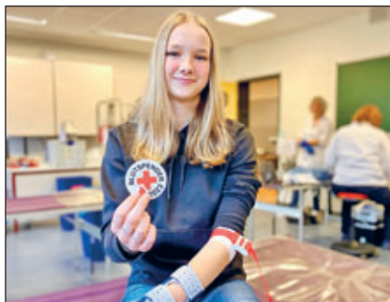
Junge DRK-Blutspenderin; ©DRK-Blutspende-dienst Nord-Ost; Nutzung in diesem Zusammenhang honorarfrei

Deutschland vor der großen Herausforderung des demografischen Wandels. Im Versorgungsgebiet des DRK-Blutspendedienstes Nord-Ost werden in den kommenden Jahren viele Spender*innen aus der spendestarken Babyboomer-Generation altersbedingt ausscheiden. Die Konsequenz: Aus Spendern werden Empfänger. Dadurch steigt der Bedarf an Blutpräparaten. Das bedeutet, dass die Solidargemeinschaft dringend mehr Menschen benötigt, die zum ersten Mal Blut spenden