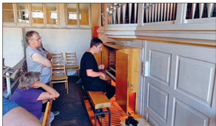
Besucher machen sich mit den Tasten der Orgel vertraut

dass es so etwas Altes und Schönes noch gibt. Und das war auch die Frage einiger Besucher, ob die Kirche noch nie zerstört wurde. Kann man von „Glück“ reden, wenn im Februar 1945 das Bauerngut neben der Kirche und viele Häuser des Ortes von Bomben getroffen wurden? Eine Luftaufnahme des Ortes der Royal Air Force vom April 45 zeigt uns die Zerstörung. Doch heute bewunderten wir die Schönheit der alten Schnitzereien oder die 1478 in Nürnberg gedruckte und 1561 neu eingebundene lateinische Bibel. Auch eine deutsche Bibel von 1650, in Lüneburg gedruckt, war zu sehen. Neben diesen wirklich uralten konnte man auch in „jüngeren“ Büchern blättern, wie dem Abkündigungs-