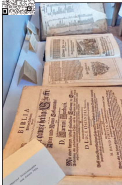
Lüneburger deutsche Bibelausgabe 1650; hinten lat. Bibel 1478

dass es so etwas Altes und Schönes noch gibt. Und das war auch die Frage einiger Besucher, ob die Kirche noch nie zerstört wurde. Kann man von „Glück“ reden, wenn im Februar 1945 das Bauerngut neben der Kirche und viele Häuser des Ortes von Bomben getroffen wurden? Eine Luftaufnahme des Ortes der Royal Air Force vom April 45 zeigt uns die Zerstörung. Doch heute bewunderten wir die Schönheit der alten Schnitzereien oder die 1478 in Nürnberg gedruckte und 1561 neu eingebundene lateinische Bibel. Auch eine deutsche Bibel von 1650, in Lüneburg gedruckt, war zu sehen. Neben diesen wirklich uralten konnte man auch in „jüngeren“ Büchern blättern, wie dem Abkündigungs-