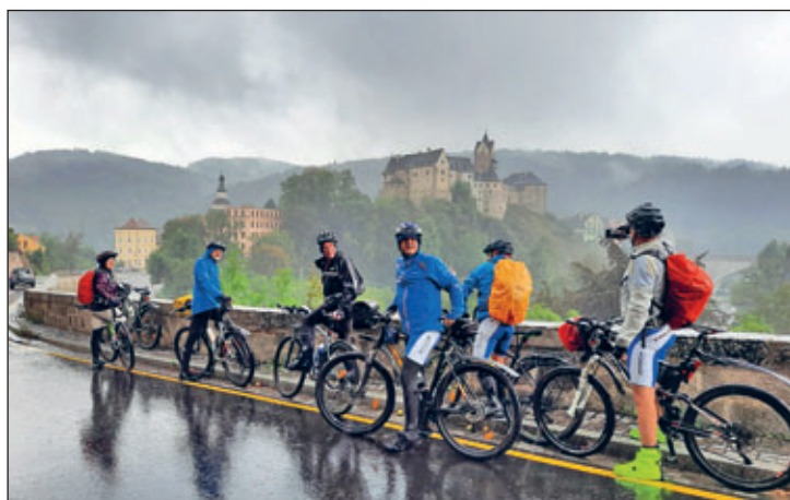
Ein flüchtiger Blick zur wunderschönen Burg Loket und dann ging's weiter durch den Regen

Leider bestätigten sich schon am Erzgebirgskamm die Wetterprognosen und es begann zu regnen. Wunderschöne Landschaften und bauliche Attraktionen erhielten so nicht jene Aufmerksamkeit, wie bei schönem Wetter. Der Wunsch nach einer warmen Dusche und trockener Kleidung minimiert die Pausenzeiten und erhöht das Fahrtempo zum Etappenziel, dem malerischen Stadtzentrum von Eger.