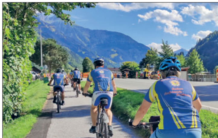
Im Namen unserer Bergstadt unterwegs – der „Blaue Blitz“

heerende Unwetter hausten und die Flüsse bedrohlich anstiegen. Würde unsere Routenplanung aufgehen? Immerhin hatten wir Radwege an Naab, Donau, Isar und Salzach auf dem Plan. Zum Glück blieb es am dritten Tag Richtung Regensburg weitgehend trocken. Mit jedem Sonnenstrahl hob sich die Stimmung in der Radlertruppe. An der Donau angekommen konnten wir am grenzwertigen Wasserstand ermessen, wieviel es in den letzten Tagen in der Region geregnet haben musste. Am deutlichsten wurde es an der Isar. In Landshut waren etliche Radwege wegen Aufräumarbeiten gesperrt und vor Brücken stauten sich Berge umgestürzter Bäume. Trotz allem fanden wir den Weg ins oberbayrische Neumarkt St. Veits. Von hier aus ging es am nächsten Tag ins schöne Salzburg. Bemerkenswert ist, wie schnell die Unwetterschäden an den Radwegen beseitigt wurden. So lagen wir sehr gut in der Zeit und konnten einen schönen Abend in der Salzburger Innenstadt erleben.