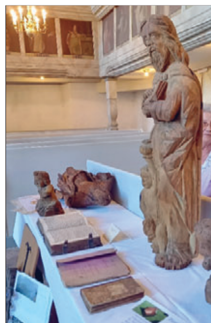
Evangelist Matthäus dazu kleine Putten, dt.:Knäblein (eigentlich hängend) vermtl. 16.Jh.

buch aus der Zeit von 1830. Uralte Landkarten von Hormersdorf konnten auch an der Wand bewundert werden. Sie sollen auch in den nächsten Wochen zur „Offenen Kirche“ hängen bleiben. Aber für die meisten ist natürlich das Besteigen des Kirchturms DAS Erlebnis. Fragen über das Baujahr, die interessante Bauweise mit den vielen Balken und auch der Glockenantrieb bewegten die Besucher. Erkundigungen wie „Wieviel wiegt so eine Glocke?“ oder „Wie alt sind die?“ wollten beantwortet werden. So verging oft eine halbe Stunde bevor man wieder an den Abstieg denken konnte.